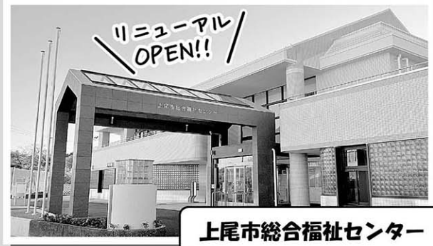
上尾市総合福祉センター

入会説明会・講習会の会場や報告書の提出についても、総合福祉センター（平塚724番地）に戻りましたので、よろしくお願いいたします。 これからも気軽にお立ち寄りください♪