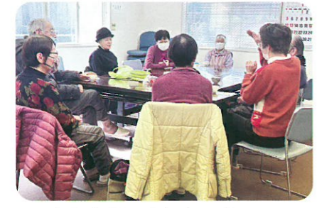
大谷支部 ふれあいカフェ