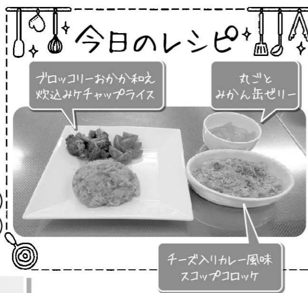
ブロッコリーおかか和え 炊込みケチャップライス