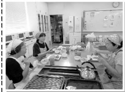
チーズ入りカレー風味 スコープコロッケ