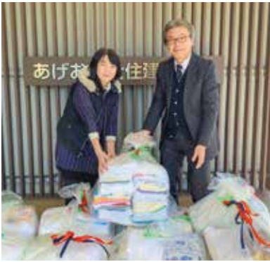
上尾白ゆり会様からのタオル寄贈

上尾市の地域福祉推進のため、本会を通じて寄付をされ、対象となった皆さまに感謝状を贈呈いたします。ありがとうございました。(50音順)