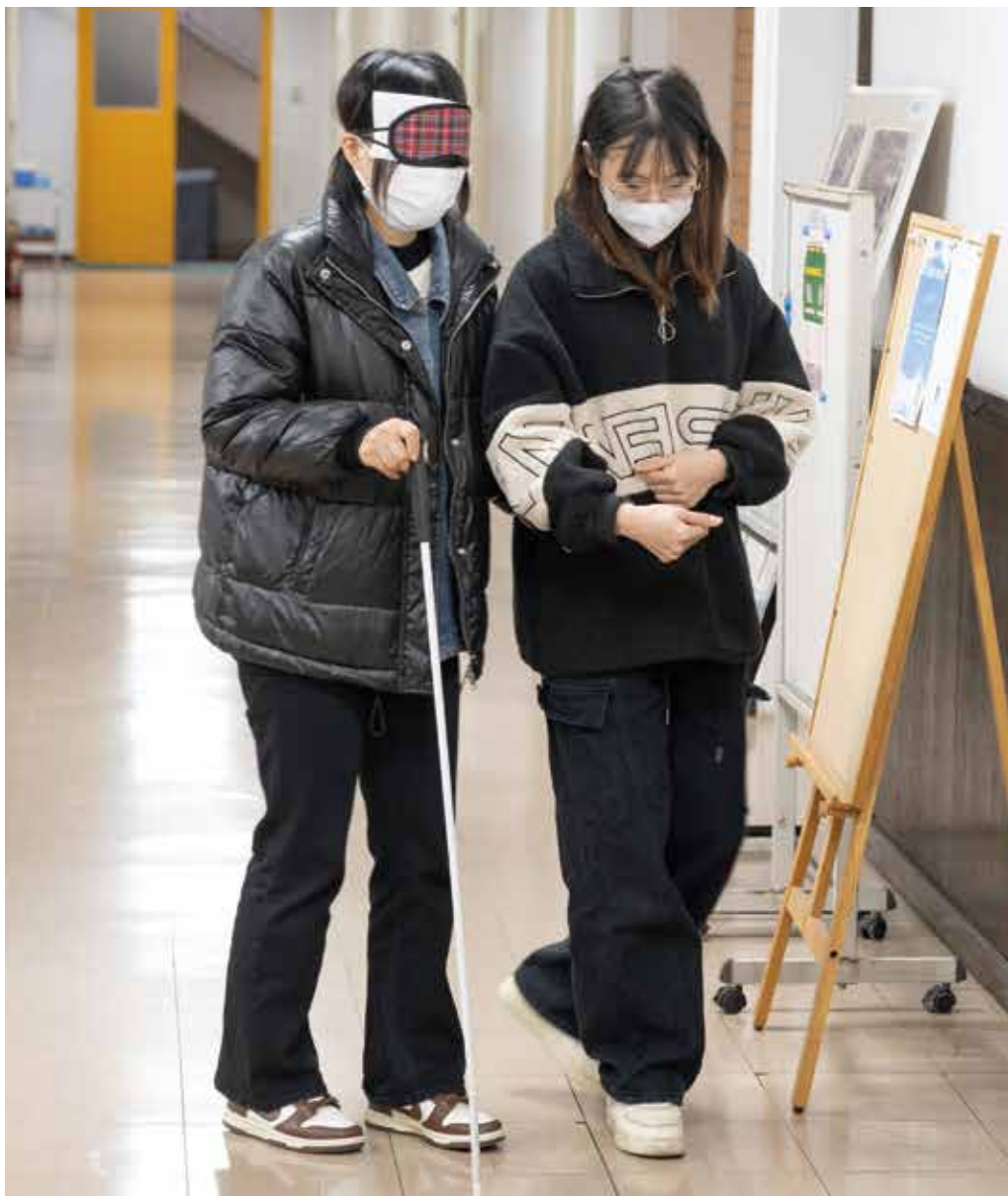
聖学院大学での白杖・アイマスク体験の様子

社協では、「福祉教育」を通じて、自分のためや、まわりの人のために考えたり、力を合わせることで、誰もがつながり支えあって、安心して暮らしていただける地域となるように、『福祉出前講座』を実施します。