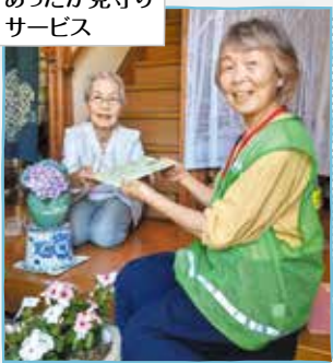
あったか見守りサービス

高齢者や障がいのある方を対象に、見守り協力員(地域のボランティア)が、定期的に自宅を訪問します。