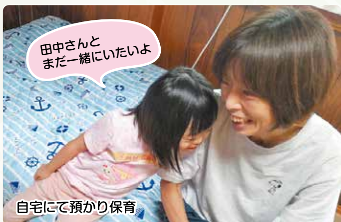
自宅にて預かり保育

最初は緊張していたお子さんも、顔を合わせる回数を重ねることで、笑顔やおしゃべりも増え、慣れてくれる姿にホッとします。