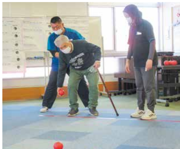
ふれあいハウスでのボッチャの様子

私たち社協職員は、この『福祉出前講座』を通じて、市民の皆さまに、事業の説明や専門的な知識を活かした実習等を行うことにより、福祉への関心を深め考えをきつかけの場として役に立てていただくとともに、社協に関する理解を深めていただきたいと思います。