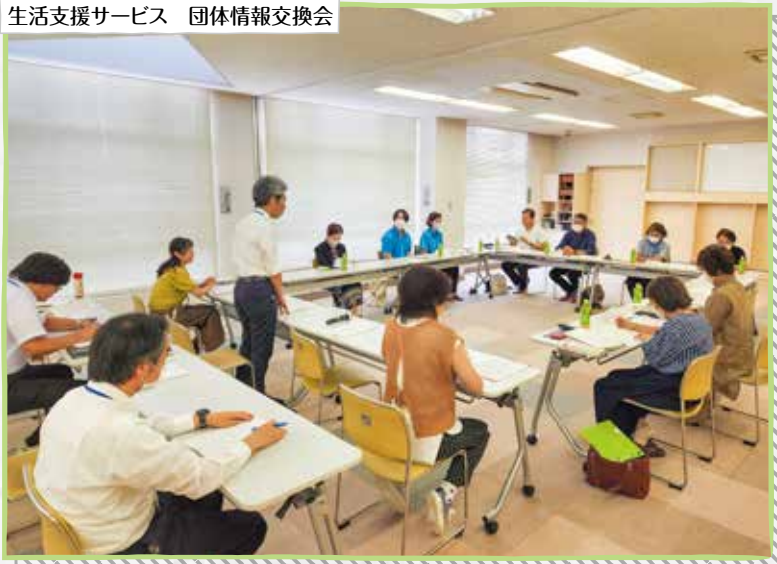
生活支援サービス 団体情報交換会

上尾市内で助け合い活動を行っている民間のNPO法人やボランティア団体、企業との情報交換をしています。 高齢化や地域の孤立化がますます進む中、人と人、団体と企業を結びつけるネットワーク支援は、お互いの活動をよりよく進めていくために大切です。