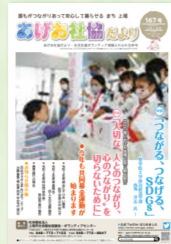
〈広報紙 社協だより〉