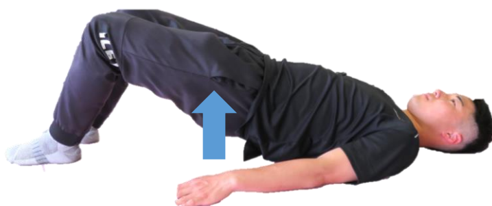
お尻の筋力トレーニング