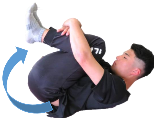
背中のストレッチ