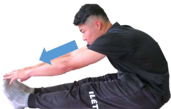
膝裏のストレッチ

腰に痛みをかかえている方は多く、一度軽快しても再発しやすいとされています。腰痛によって生活の動作に支障をきたしたり、活動量が減少することで、フレイルにも繋がってしまいます。腰痛を予防する体操を実施していきましょう！