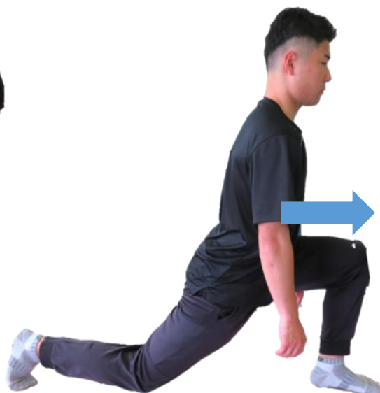
股の付け根のストレッチ