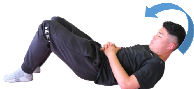
腹筋の筋力トレーニング