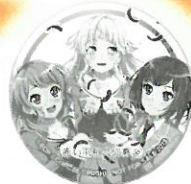
illustration by 三月八日 ©Crypton Future Media, INC. www.piapro.net piapro