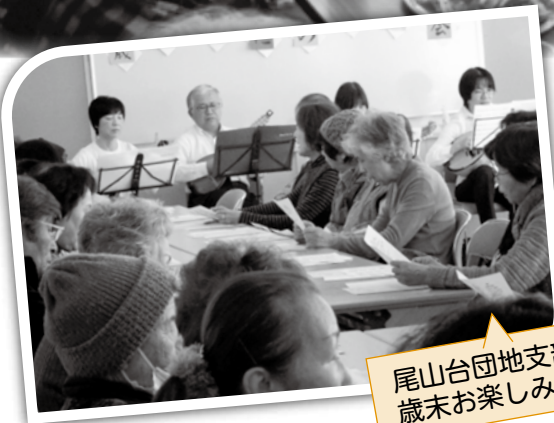
尾山台団地支部 歳末お楽しみ会