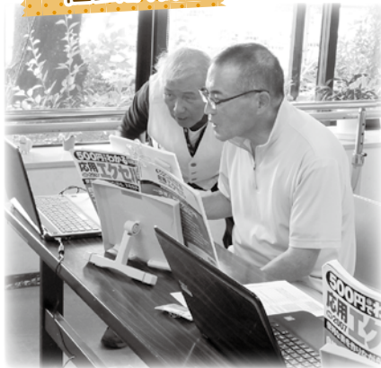
失語訓練、パソコン教室