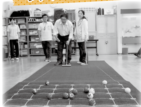
リハビリ訓練、スポーツ・レクリエーション、健康吹矢、健康体操教室