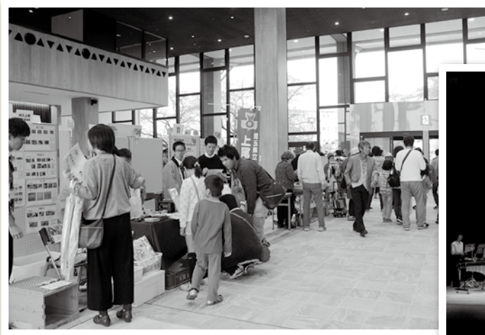
ハワイエでの展示および販売の様子