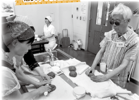
料理・パン、歌声、陶芸、絵手紙、パステル画、フラワー、スマイルカフェ教室