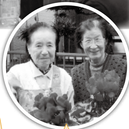
上平支部社協 70歳以上の 単身者へのシクラメン配布