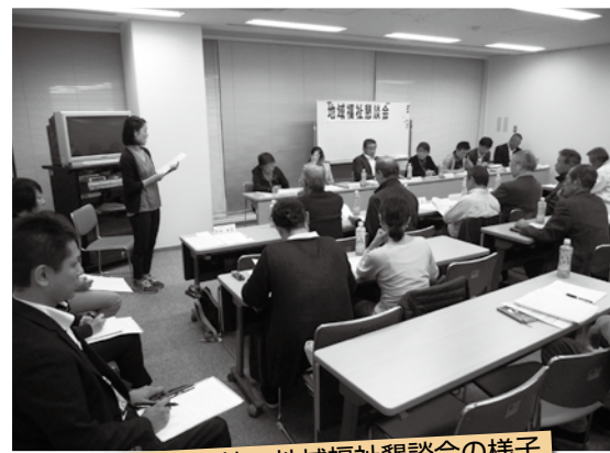
平方支部社協・地域福祉懇談会の様子

最初の一步には、「助けてとの訴えを聞いた」、「一緒にやろうと誘われた」、あるいは「広報を見たから」と、人それぞれに「きっかけ」があります。参加した方からは、「対象者の方からエネルギーをもらえた」、「地域の中で役割をもてた」、「知り合いが増えた」との声が数多く聞かれます。「みんなの小さな一歩が、助けたり助けられたりのぬくもりのある地域をつくる」と、一人でも多くの協力者の発掘について、地域の関係者は話し合いを重ねております。