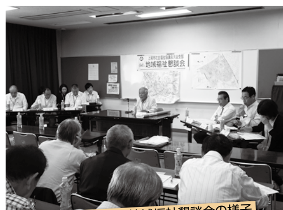
大谷支部社協・地域福祉懇談会の様子

「お互い様の助け合い活動をしようと思っても、相手の困りごとが見えない。向こう三軒両隣で、あいさつができる地域づくりが必要」