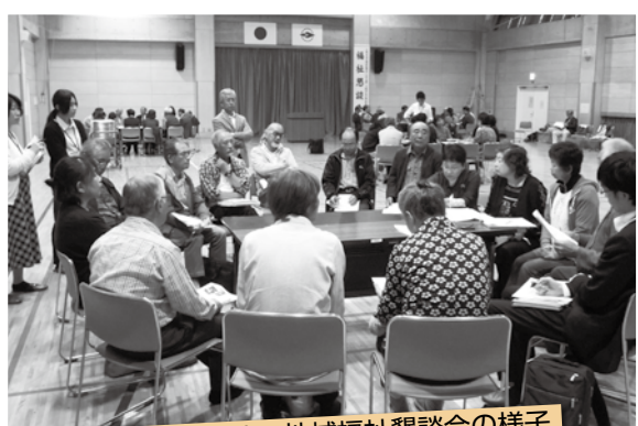
上平支部社協・地域福祉懇談会の様子

「表舞台に出ていない人でも、なんらかの細い糸で地域の活動とつながりはあるはず。その結びつきを太くするため、イベントなどで積極的に声をかけ、活動に誘う機会を増やそうと思う」