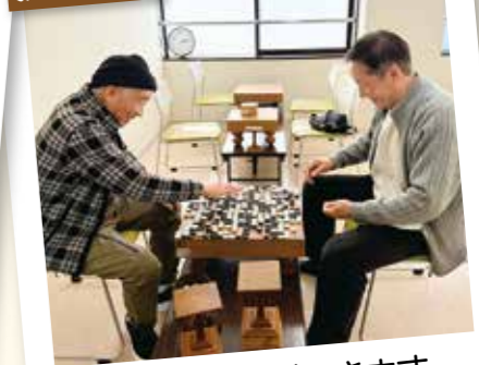
囲碁・将棋ができます