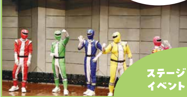
あげお学童クラブの会 ヒーローショー