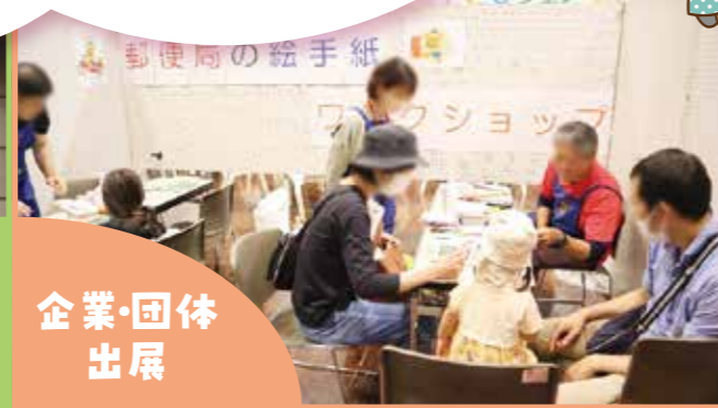
上尾プレーパーク めぶきの会