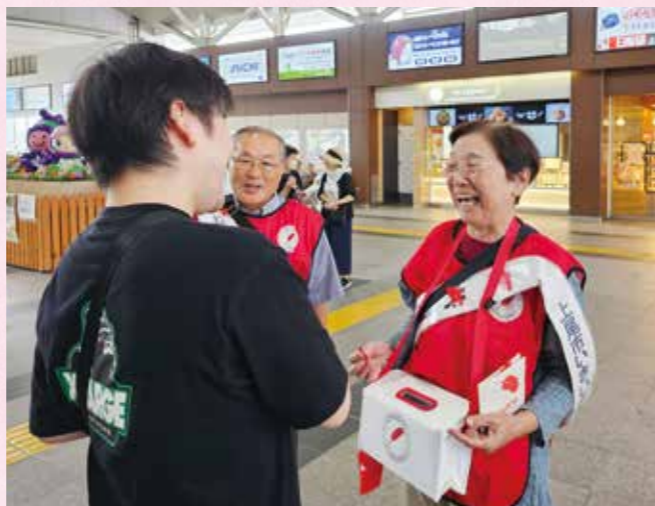
令和7年度街頭募金活動の様子(上尾市いきいきクラブ連合会の皆さま)

市内中学生を対象に街頭募金ボランティアの募集も予定しています。皆さまのご協力よろしくお願いたします。 ※詳細については、当会ホームページ等においてお知らせいたします。