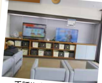
手話や文字で情報が 得られるテレビもあります