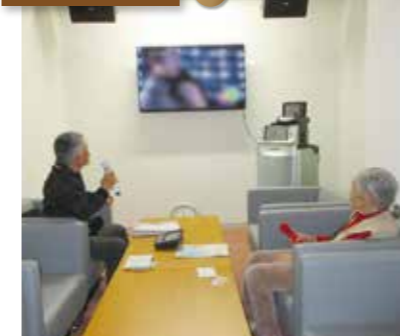
1日1時間～利用できます