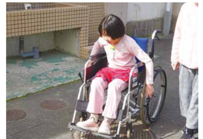
福祉教育「車いす体験」 小中学校などで車いすやアイマスクなど福祉教育が体験できます。