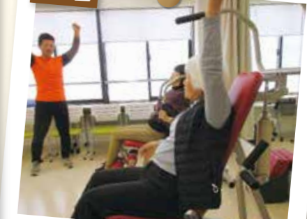
自由に利用できるマシンジム 毎週月曜日に講座があります