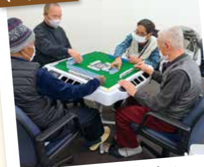
楽しく健康マージャン