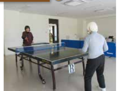
卓球・シルバーゲーム スポーツができます