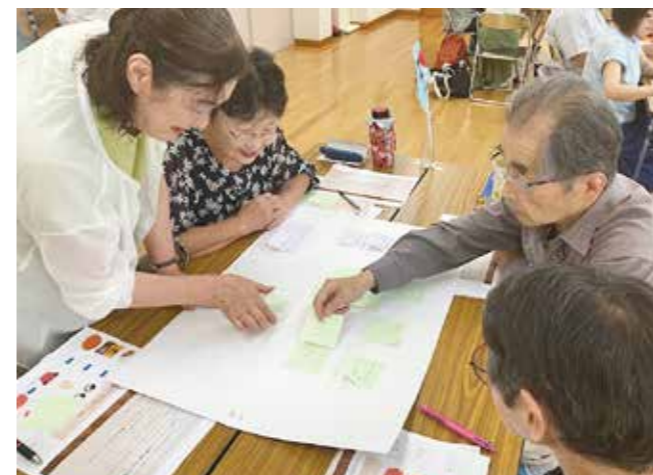
西宮下一区町内会 住民向け講座「認知症初期講座」 地域のみなさんが集まって学ぶ機会になっています。