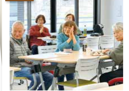
皆さんが集まっておしゃべりや 食事もできます