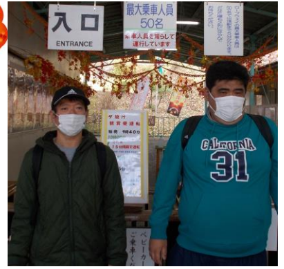
これからロープウェイで山頂へ！ちょっと緊張…