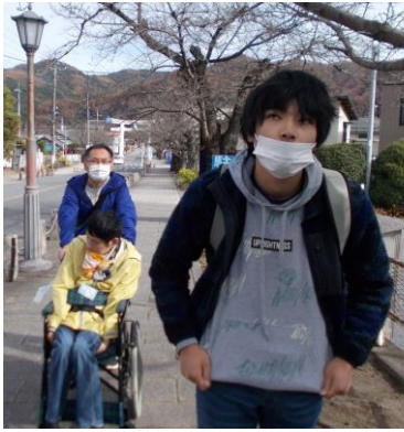
穏やかな陽気で散策日和☆