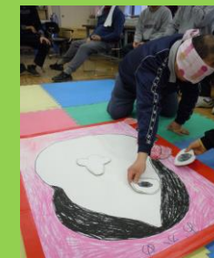
みんなで綱引きや福笑い (余暇活動の1コマ)